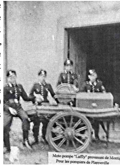
Moto pompe "Laffly" provenant de Montigny-lès-Metz Pour les pompiers de Plappeville

équipements spoliés après le retrait allemand. Il mentionne l'habillement complet de 12 sapeurs-pompiers (casques, ceinturons, costumes...), une pompe, 500 mètres de tuyaux de 52 mm, 2 échelles à crochets de 4 mètres, une échelle à coulisse de 10 mètres, 2 lances et divers petits matériels.